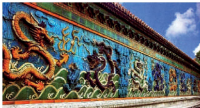
1-nji surat. Beýhaý seýilgähindäki Dokuz aźdarhalaryň diwary. XVIII asyr. Pekin şäheri

Änew metjidiniň aźdarhaly bezegi hytaý ynanyçlaryndaky aźdarhalary ýada salýar. Hytaý mifologiýasynda aźdarhalaryň birnäçe görnüşleri bolup, olaryň arasynda suwuň hökümdary, ýagys-ýagmyryň howandary baş aźdarha Lun-wan bolupdyr. Belki-de şu ynanç boýunça Ab-a-Nau – “Täze suw” diýen manyny berýän Änew şäheriniň metjidinde şeýle şekil ýerleşdirilendir [5, 129]. Gündogar Aziýanyň sungatynda iň ýaýran şekilleriň biri bolan aźdarha dürli düşüňjeleri bagly bolupdyr. Aźdarha goragy, älemde köptaraply tertibi üpjün edýän güýji alamatlandyrypdyr. Ol dünýäniň dört künjüniň goragçylaryň biri hasaplanylýp, hökümdaryň kuwwatyny we häkimiýetini aňladypdyr [9, 57]. Hytaý binagärliginiň orta asyr nusgalary bolan Pekindäki Taýhedýan köşk desgasyňyň içki görnüşinde [10, 392], Sinýandýan ybadathanasynyň içki gümmeziniň bezeginde [10, 395], XVIII asyrdaky gurlan Beýhaý seýilgähindäki Dokuz aźdarhalaryň diwarynda [4, 395] ( 1-nji surat ), Koreý Respublikasynyň Seul şäherindäki 1394–1396-njy ýyllarda Kýonbokkun köşgüniň Kynjonjon tagt pawilýonyň zalynda aźdarhalaryň şekilleri [8, 149] ýerleşdirilmegi dürli medeniýetleriň arabaglanyşygyny görkezýär.