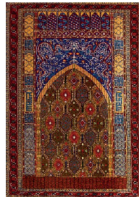
7-nji surat. Sähragül Peşşiyewa. Seýit Jemaleddin ýadygärligi. 2019 ýyl