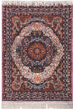
4-nji surat. “Güberçekli aždarha” nagşly haly. 1952 ýyl